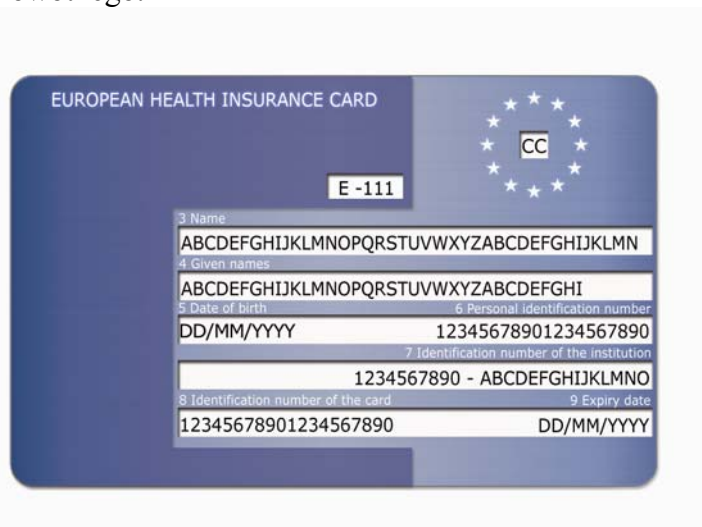
Rys. 1: Przykładowy awers karty