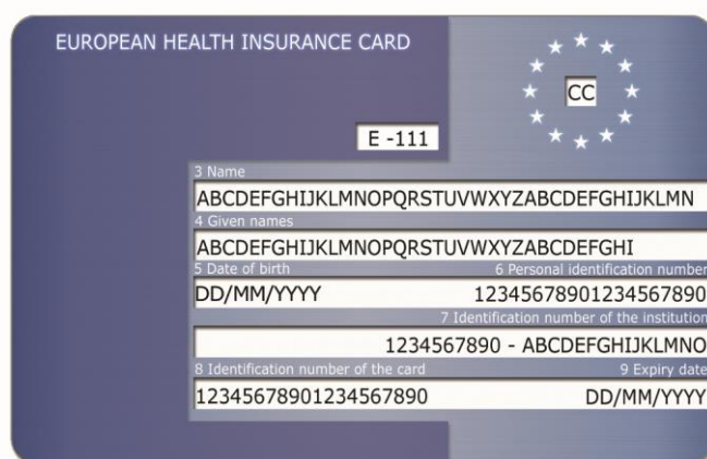
Rys. 1: Przykładowy awers karty