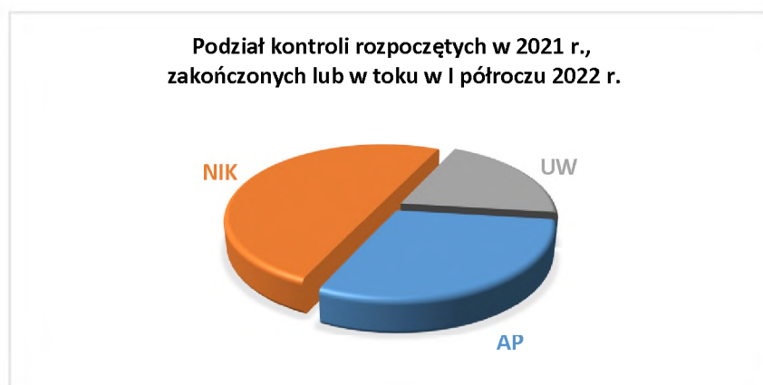
Wykres nr 1