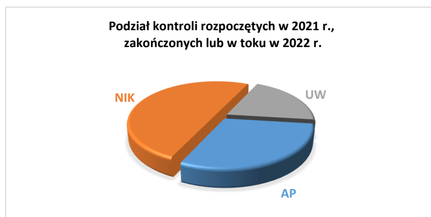
Wykres nr 1