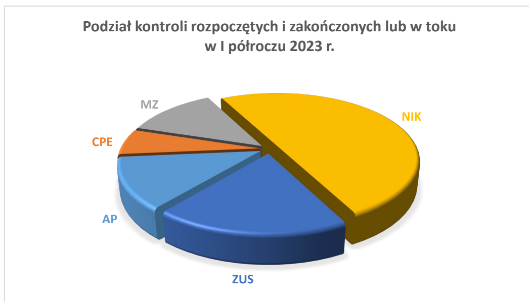
Wykres nr 2