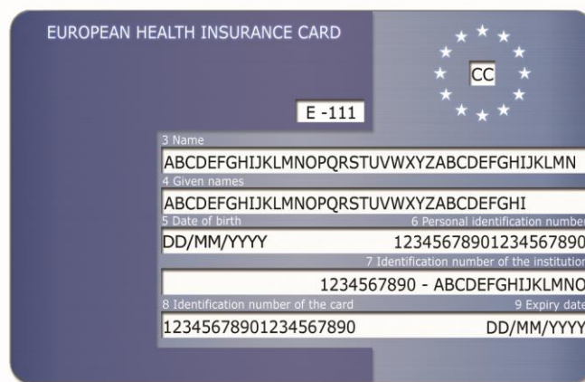
Rys. 1: Przykładowy awers karty