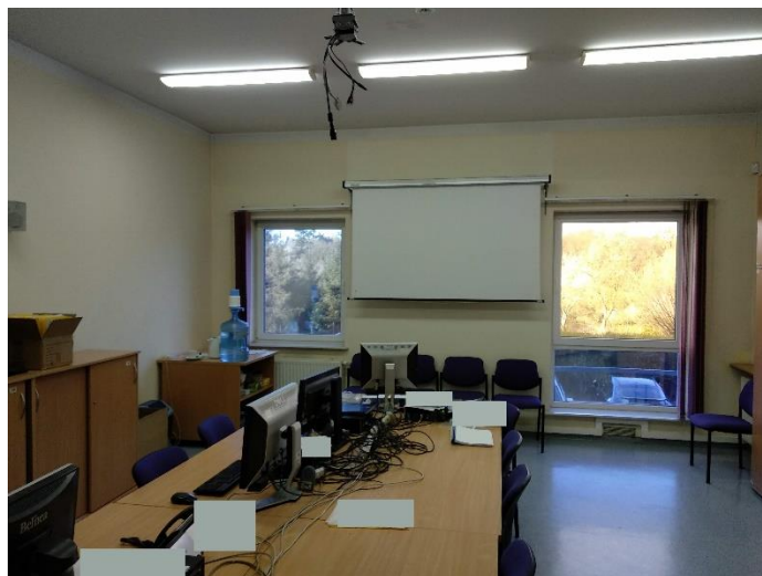
Zdjęcie 4 – rzut sali konferencyjnej widziany naprzeciwko wejścia bocznego do sali